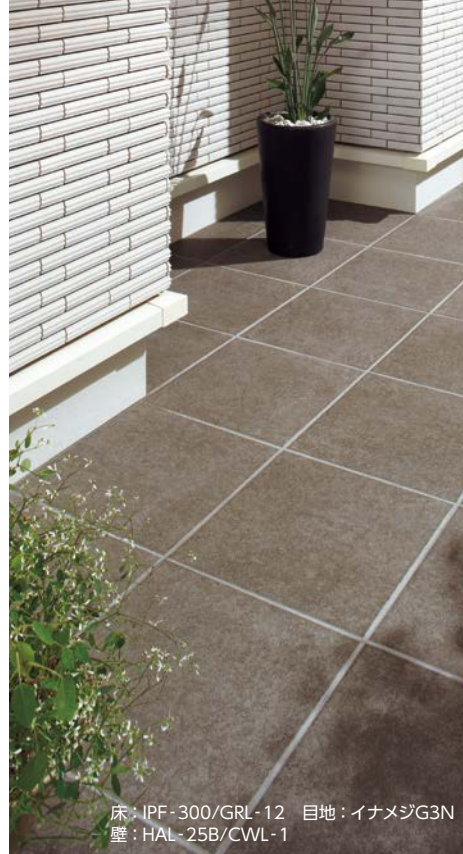
床：IPF-300/GRL-12 目地：イナメジG3N 壁：HAL-25B/CWL-1